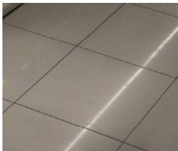
I、店内セラミック床