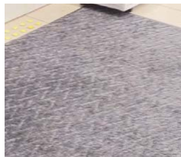
II、カーペット/ フロアマット