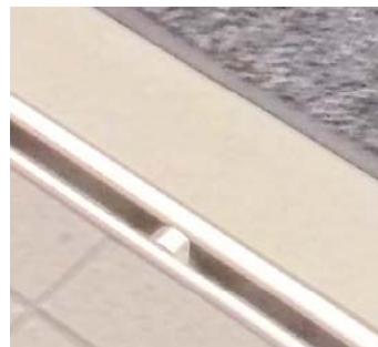
III、入口部分のドア溝